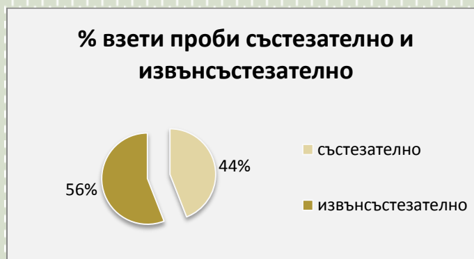
Фиг. 2. Съотношение в проценти /%/ състезателно и извънсъстезателно тестване – АДЦ ПРП

От общия брой 758 взети проби, 65 са кръвни (включително 3 кръв за биологичен паспорт на спортиста), което е изчислено в проценти (виж диаграмата отдолу). През август 2017г. Антидопинговият център стартира хематологичния модул от програмата за биологичния паспорт на спортиста.