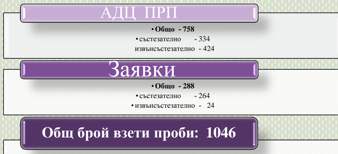
Фиг. 1. Брой взети проби за 2017г.

Антидопинговият център (АДЦ) изпълни своя план за разпределение на проверките за 2017г. (ПРП), разпределяйки ресурсите си както за състезателно, така и за извънсъстезателно тестване. През 2017 г. бяха тествани спортисти, получили квоти за участие в XIII Европейски младежки олимпийски фестивал 2017 г., гр. Ерзурум, Турция и летен младежки олимпийски фестивал 2017 г., гр. Гьор, Унгария, спортисти с квоти за участие в Зимните олимпийски игри в ПьонгЧанг, 2018 г., както и спортисти от спортни училища от цялата страна. АДЦ проведе и състезателно и извънсъстезателно тестване по заявка на други антидопингови организации (АДО) и/или международни/български спортни федерации.