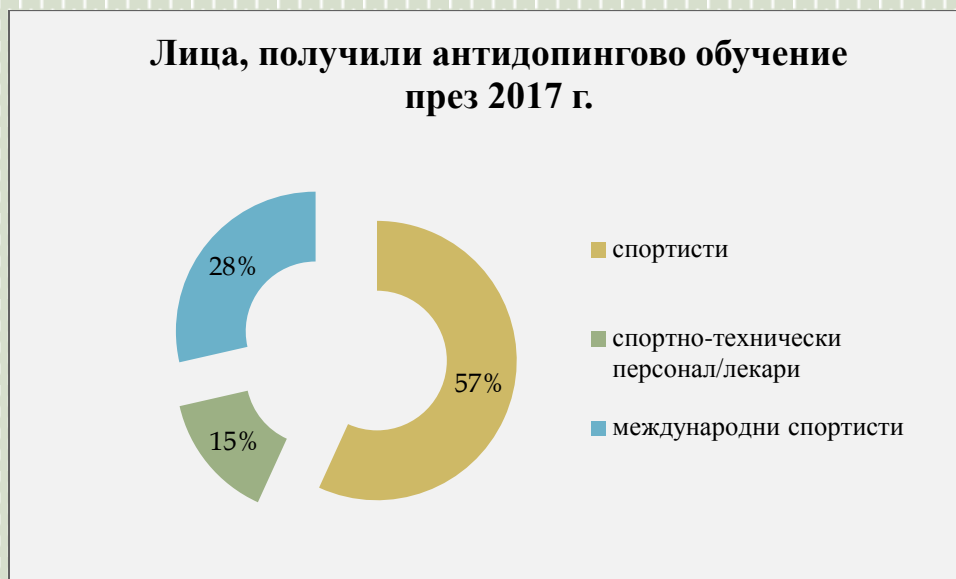
Фиг. 7. Процент /%/ на получилите антидопингово обучение по категории