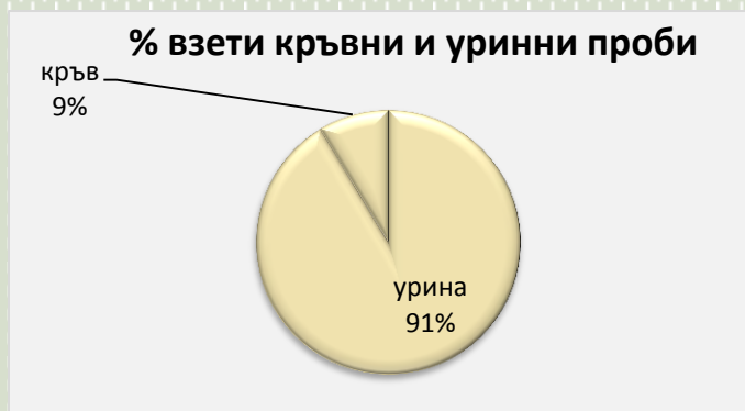
Фиг. 3. Съотношение в проценти /%/ на взети кръвни и уринни проби

Броят на спортовете, тествани от АДЦ, е 24 . Таблицата и следващите я диаграми представят броят на извършените тестове по спортове, както и разпределението им състезателно и извънсъстезателно. Спортистите, които са тествани през 2017 г. е 576 , от които 370 са били обект на допингов контрол за първи път.