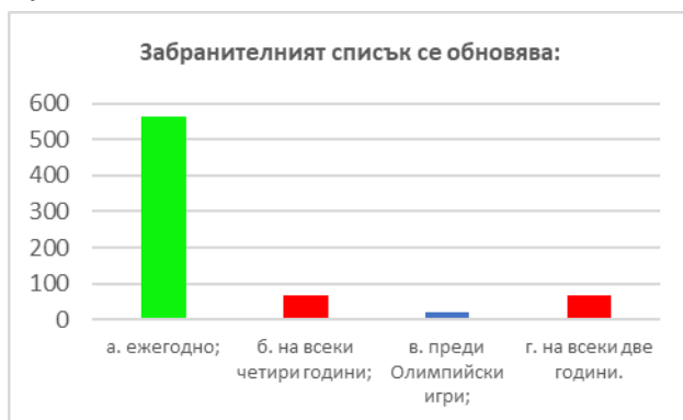
Фиг. 5. Отговор на въпрос 1 от анкета за оценка на знанията /в зелено е маркиран верният отговор/

През 2023г. беше обърнато повече внимание на критериите за включване на субстанция в Забранителния списък и статута на лекарствата. Прави впечатление, че участниците почти не допускат грешки на въпроси за Забранителния списък /фиг. 5/.