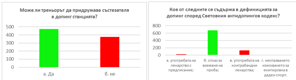
Фиг. 3 и 4. Отговори на въпроси 2 и 3 от анкета за оценка на знания / в зелено е маркиран верният отговор/

В предстоящите обучения през 2024г. ще бъде обърнато по-голямо внимание на правата и задълженията на състезателите по време на процедурата по допинг контрол, както и на рисковете свързани с употребата на лекарства и хранителни добавки. Изводите за това са на базата на проведените анкетни проучвания за оценка на получените знания по време на антидопингово обучение /фиг. 4 и 5/.