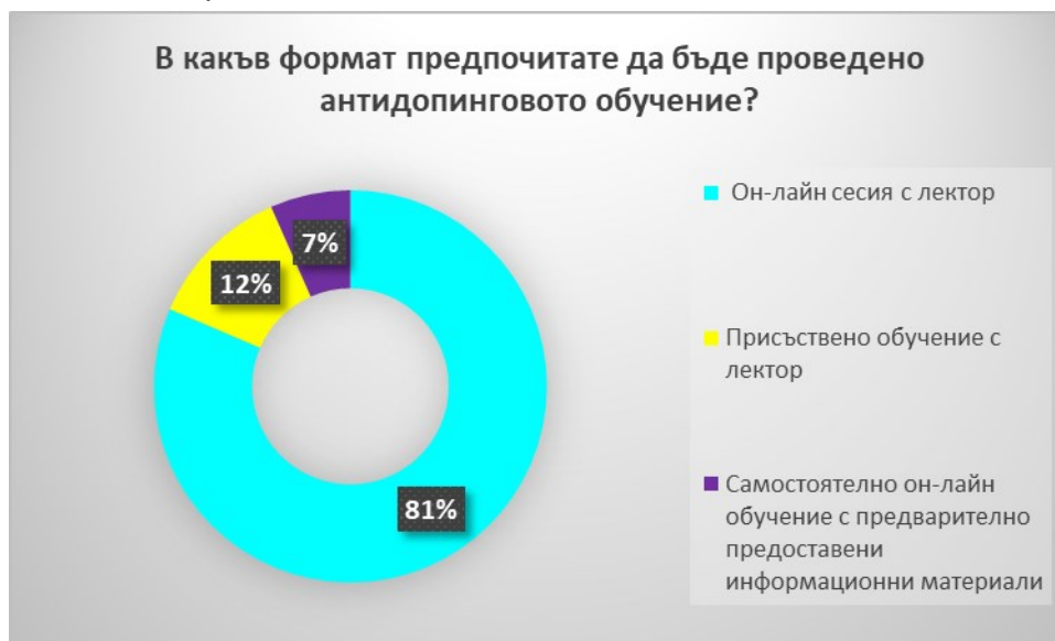
Фиг. 2. Предпочитания на участниците /състезатели и спортно-технически лица/ за формата на провеждане на антидопингово обучение.

Разработването, изпълнението и оценяването на настоящия план се осъществява от експерти в направление „Антидопингови програми“ и контрол върху тези дейности се изпълняват от Изпълнителния директор и Главния секретар на Антидопинговия център. Необходимите ресурси за изпълнението на настоящия план са заложи в бюджета на организацията.