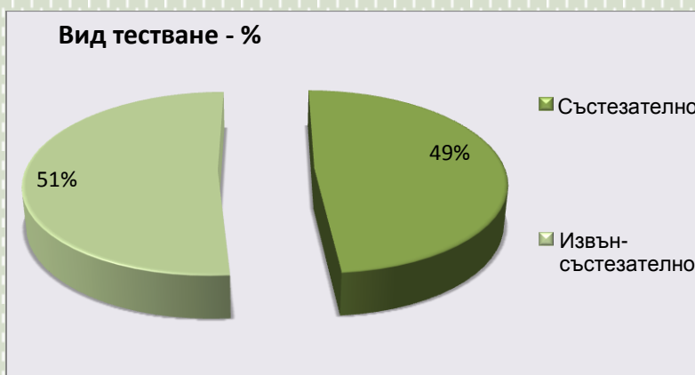
Фиг. 2. Съотношение в % състезателно (In-competition) и извънсъстезателно (Out-of-competition) тестване – АДЦ ПРП

От общия брой 491 взети проби, 33 са кръвни, което е изчислено в проценти (виж диаграмата отдолу).