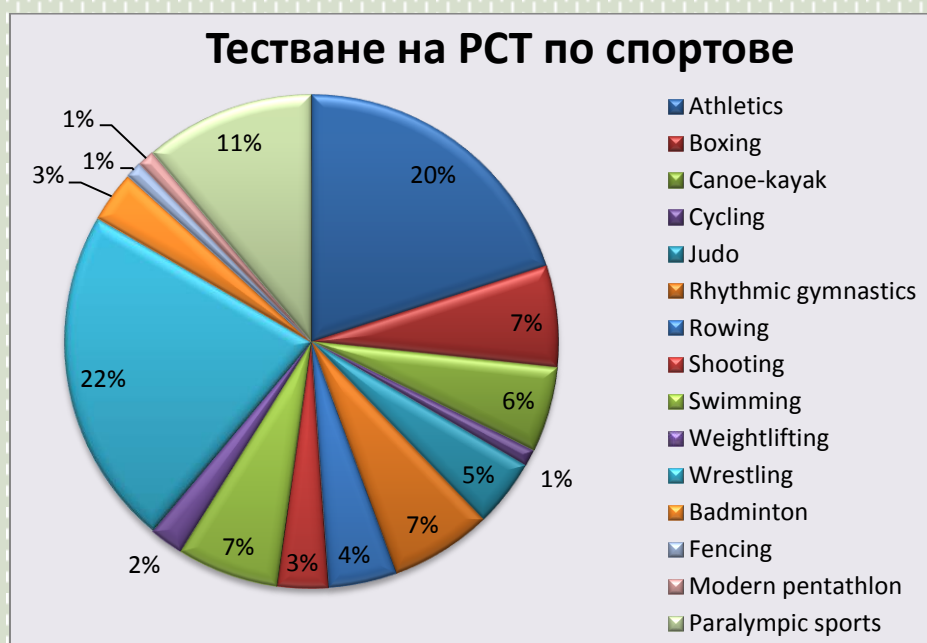
Фиг. 8. Взети проби в % по спортове