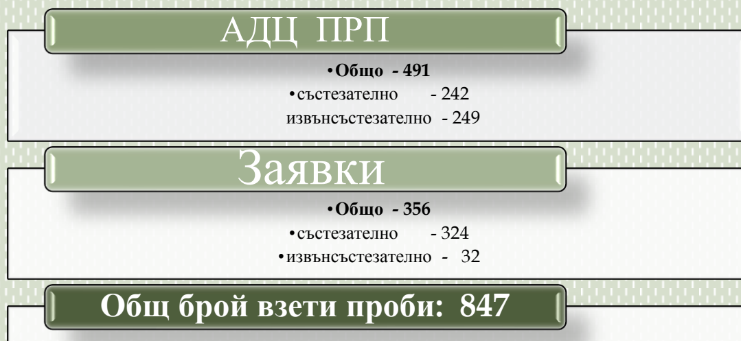
Фиг. 1. Брой взети проби за 2016г.

Антидопинговият център (АДЦ) изпълни своя план за разпределение на проверките за 2016г. (ПРП), разпределяйки ресурсите си както за състезателно, така и за извънсъстезателно тестване. Значителна част от програмата за тестване беше насочена към спортистите, с квоти за участие в Летните Олимпийски и Параолимпийски игри в Рио де Жанейро 2016 г. Също така, АДЦ проведе състезателно и извънсъстезателно тестване по заявка на други антидопингови организации (АДО) и/или международни/български спортни федерации.