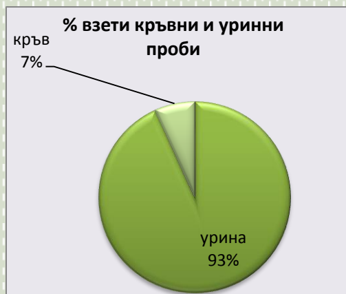
Фиг. 3. Съотношение в % на взетите проби – кръвни и уринни проби

Броят на спортовете, тествани от АДЦ, е 25 . Следващата диаграма представя извършените тестове по спортове, състезателно и извънсъстезателно.